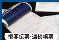
複写伝票・連続帳票