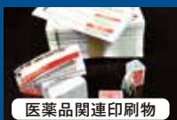
医薬品関連印刷物